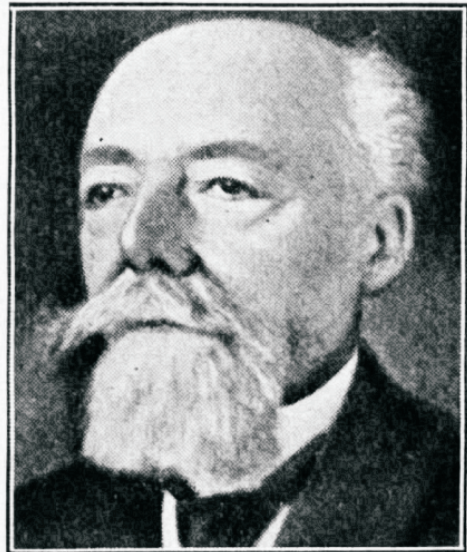
7. mail f. a. julma furitöö ohwriks langenud prantluse president Paul Doumer .

Selles rahutus elus igatsleb inimene hingamise ja rahu järele; rahu järele, mis teda õnnelikkus teeks. Kui õnnelik pidi olema esimene inimpaar, kui nad Looja läheduses elades ei tundnud weel patu needust ja häda, waid rahu ja rõõm walitsejad maailma, mis kandis täiuslikkuse pitsatit.