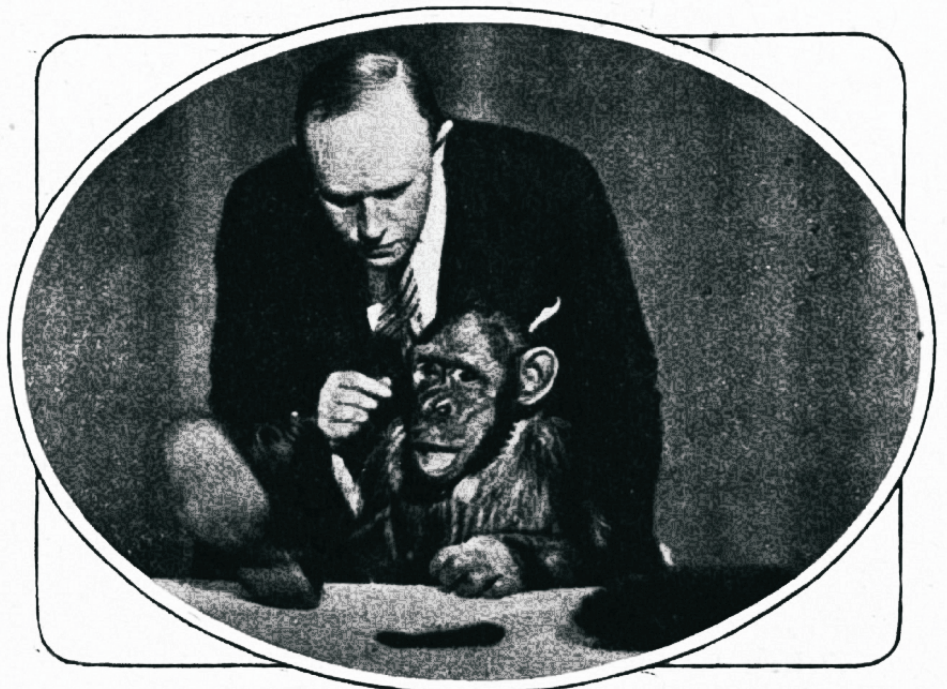
Rahsed ahwi õhtuõlliseerida on seni tagajärjeta jäänud.

Jumala unustamine on suurim patt — see on kõige kurja juur. Ta on ka kogu õnnetuise ja wi- letjuse põhjuseks maa peal. Juba wanal ajal ütles igawene: „Aga et ma olen hiiudnud, ja teie olete