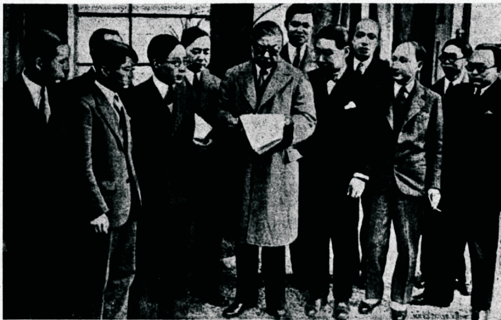
Hiina delegatsioon desarmeerimiskonverentsil, Genfis.

„Reemiline ja arwatavasti ka bakterioloogiline sõjapidamine ei arene sõja käiguga, waid need algatawad sõja ja määravad selle käigu. Wäga tõenäoliselt tungib iga sellesse kistud maa kohe