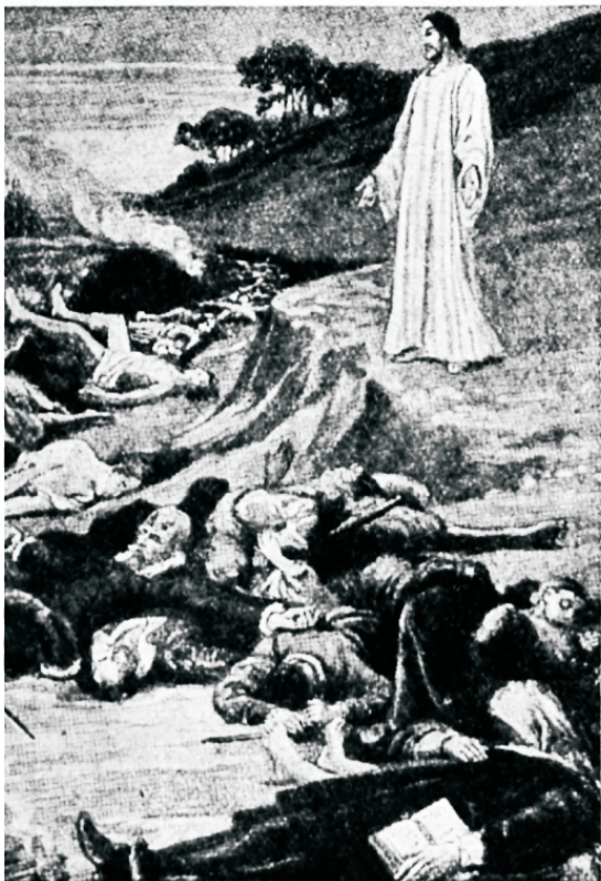
turb saatus mineewitus.

tekkisid noore ristifoguduse õppetusrüüd ja teisel sajandil terve rida furatlike waleõpetusi, mida meie gnostitsismi all mõistame. Sellest kaswas hinu auametite järele, millest wiimaks paawstlik aujärg tekkis.