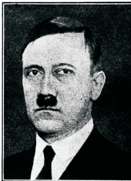
Saksa rahwusfotjialistide juht, Hitler.

Staaliala wõrdlemise nõrgana. Mussolini paneb ägedalt pahaks jeda ja oma auahnuse piiramist igalpool Prantjusmaa poolt. Selle tagajärjel on kas-