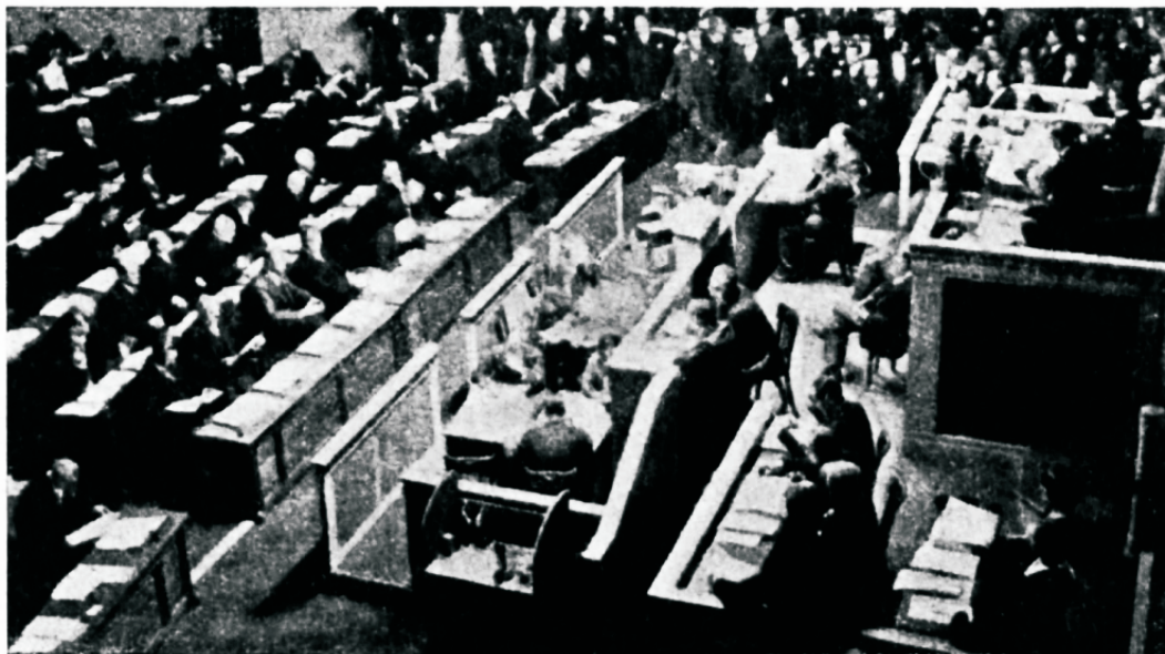
Desarmeerimise konverentsi istang Genfis.

Nüüd on unistus tõelikkus. Maakera igast afustatud osast on juhtivad mehed tulnud palest pa-