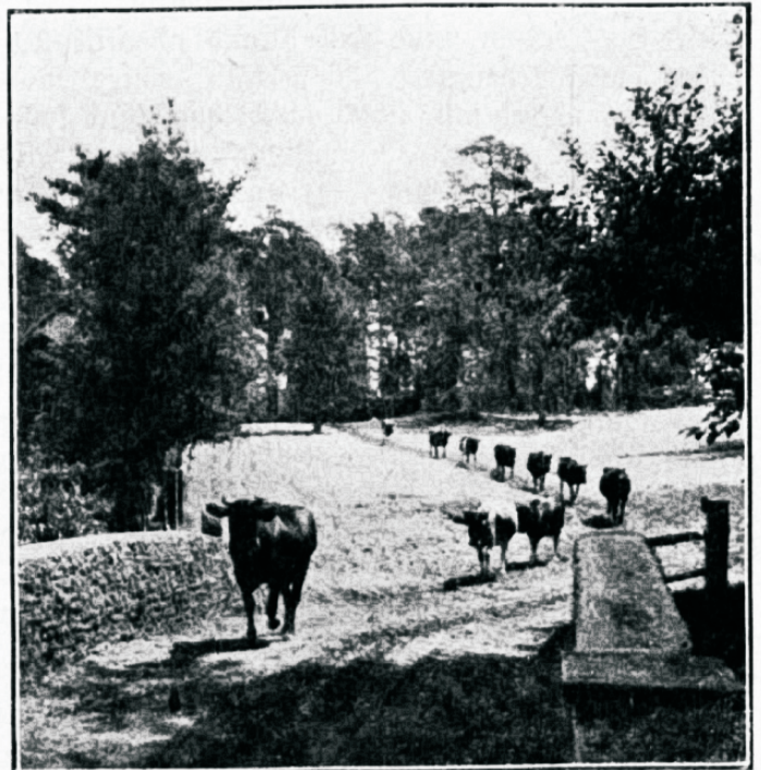
Laske neil elada.

Selle pahe kõrwaldamiseks peab olema hoolikam piima tootlemises ja jellega ümberkäimises ja