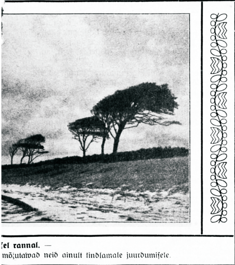
el rannal. — mõjutawad neid ainult lindsamale juurdumisele.

Ja surm peab olema, sest et ta kunagi kufagil ilmaruumis ei hoita elus neid, kes ei taha lahkuda patust — ja neid on palju — sest siis patt muutuks igaweseks ja Sumala looming ei wõdi kunagi olla täiesti puhas ja õiglase. Nii tahab Sumal häwitada pattu ja patuseid, kes teelduwad patust päästmisest ja meie peafime olema tänulikud, et ta tahab seda. Surm, millest meie kirjutame, on igawene surm. Surm, mis tuleb õiglastele ja millest on ülestõusmine, pole tõeliselt surm, waid ainult pikk uni, nagu Jeesus ütles Mariale, Latjaruse õele. See on tulnud peamiselt selle pärast, et kurati wõimalus pidi kestma teatud aja ja Sumal tegi õiglaste inimeste elu lühikeseks, et