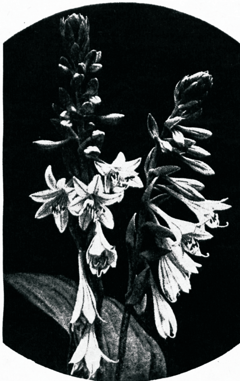
„Pange tähele illetefi wälja peal...“

Rasked ajad mõjuwad terwendawalt ka usk-