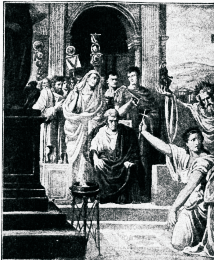
Õfimesed kristlased jäid Kristusele us

on kõik muu maailmas juhtunu, tähtsusetu ja kõrwaline.