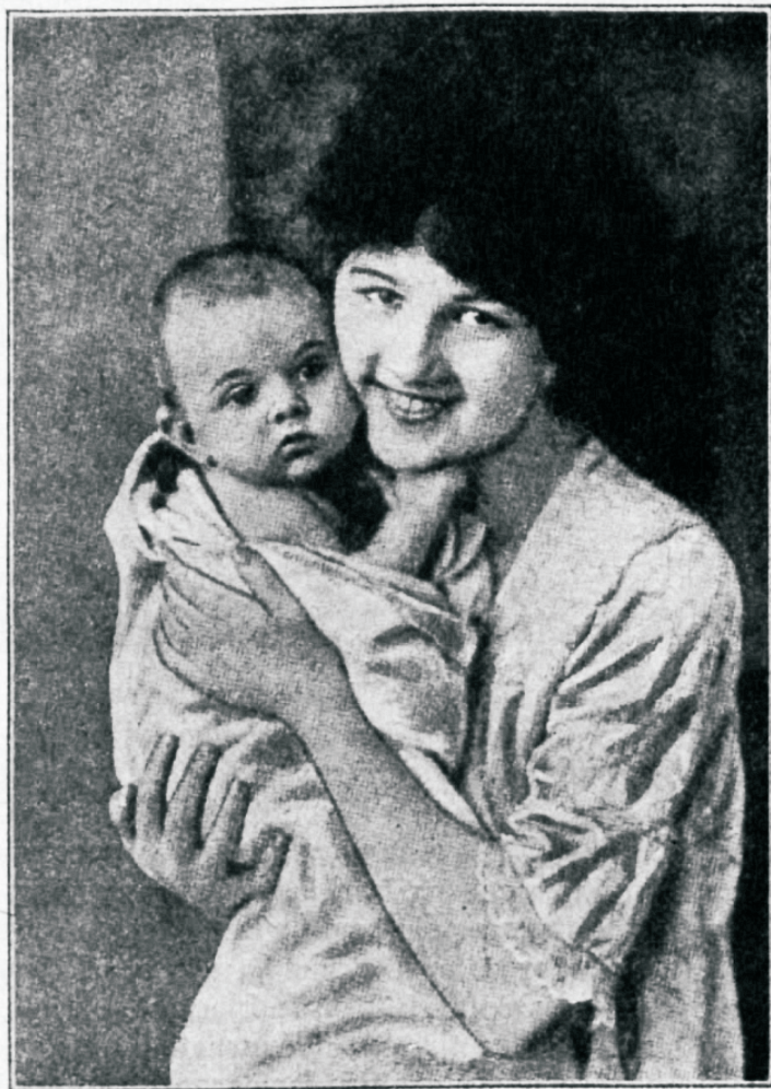
Sooduse ilufaim koostõla.

Itka jälle tulewad ette olukorrad, kus wälise sunni hädawajalikkuse tõttu ei arwestata lapse armastuswajadusega. Hingeliseks arenemiseks on wäga suure tähtsusega, et rahutustegewad elamused pehmemdamata ei läheks üle järgmisele päewale. Lapsed peawad uinuma armsate mõtetega. Unes ei arene ainult lapselik teha waid ka waim. Pole sugugi ütskõit, milline on pind, millel wõrsub see arenemine. Päewane riid ja pahandus peab osawa käega wiidama üle peh-