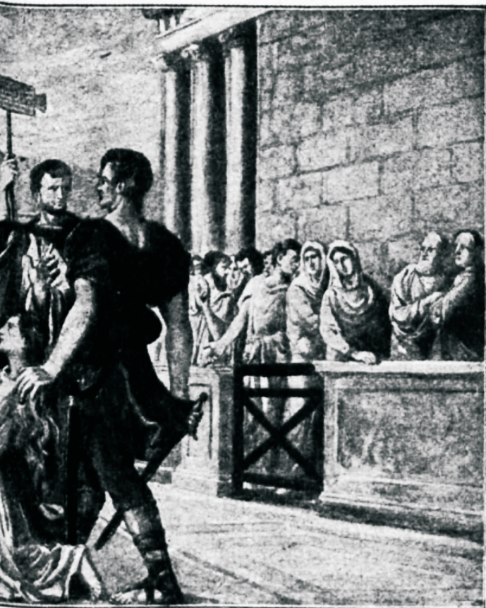
Waks ka siis, kui see neil elu maksis.

Usulise tundmise asupaik on kahtlemata meel, sest selles on ka waimlise olemise wõime saada tunda Jumalat ja olla sellest teadlik. Meie meeles peitub meie usu põhialus, sest apostel Paulus kirjutab, et meie peame „ustuma meelega“. Selle järele peab waatama meelt kui toetuspunkti lunastawa armu kogemuses, mille läbi Issand oma armastuses tõmbab meid enese juurde.