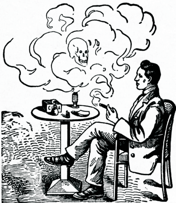
Nitotiinil on sama halb mõju, kui alkoholilgi.

Alkohol on närwimürk, mürk peaaajule. Tema haarab meie kõrgemasse, waimlisesse elusse seega,