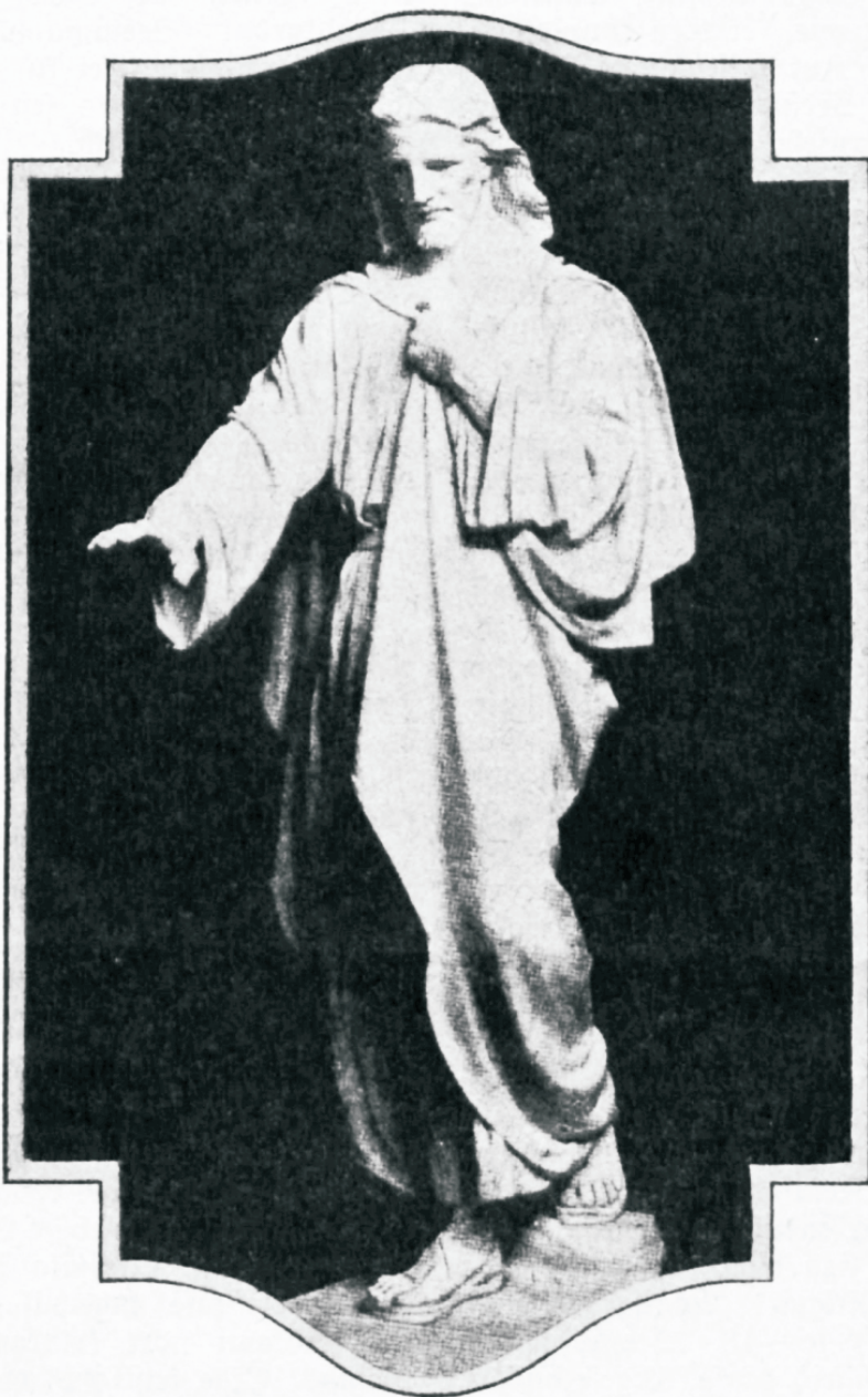
„Tulge minu juurde kõit, kes...“ — Kristus.

ma igawese elu pärin?“ Nüüd arenes tähelepanuwääriline tõne käsu üle. Noor mees toonitas, et ta seda juba lapsest saadit pidanud. Jeesus waatab temale igatsewa südamega ja armastawa pilguga, nagu ta pale wõis iganes hiilata. Jeesus pani ette raste nõude. Et see selles seisfis, kas noormees on nõus oma suurt warandust andma waeste hääks ja Jeesuse järel käima, siis noormees pöörab kurwalt temale selja. Lastis fergemeelselt wõimalusel mööda minna. Kas