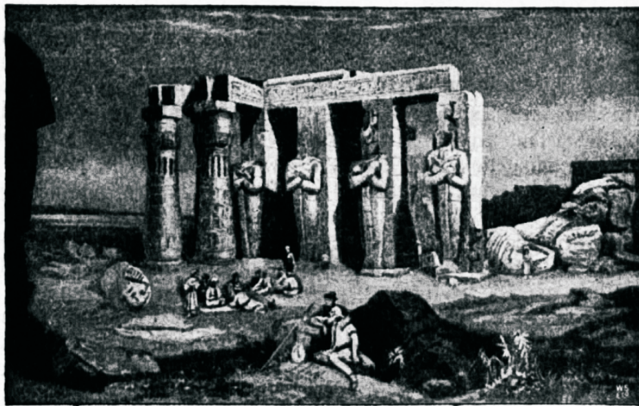
Niiluse hiiglaehituste wareded.

firjadega, aga ükski inimene ei Egiptuses ega mujal ei tunnud nende tähendust. See ekspeditsioon on aga teadusele ja arheoloogiale teinud suure teenuse, paljastades „Rosettetahwi“ — nimetatud oma ajukoha järele Rosettes, Aleksandria lähedal. See tahwel sai üles seatud umbes 200 a. enne