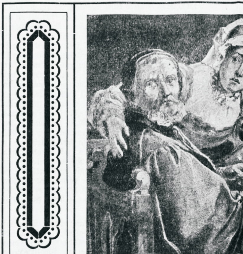
Piibel — raamat, mille lugemine oli walitse

Esiteks kreeka-katoliiku kirikust. Tema läbi on kadunud maa päält Kreekamaa muistsed jumalad.