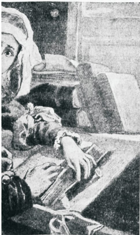
teelatud, kui rooma-katoliku wõim