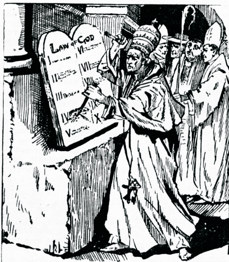
„... tema mõte on aega ja (Jumala) tästusid muuta.“

Tanieli raamatus, Tessaloonika ja Ilmutamise raamatu ettekuulutustes on kirjeldatud aastasadade sündmused, mis käsitlevad langemise meistertiiki — paavstivõimu. Rooma õpetused on pühaduse järeleaimamine või võtmine. Väewalt on olemas Roomas õpetust, mille juured ei ajetuks ma-