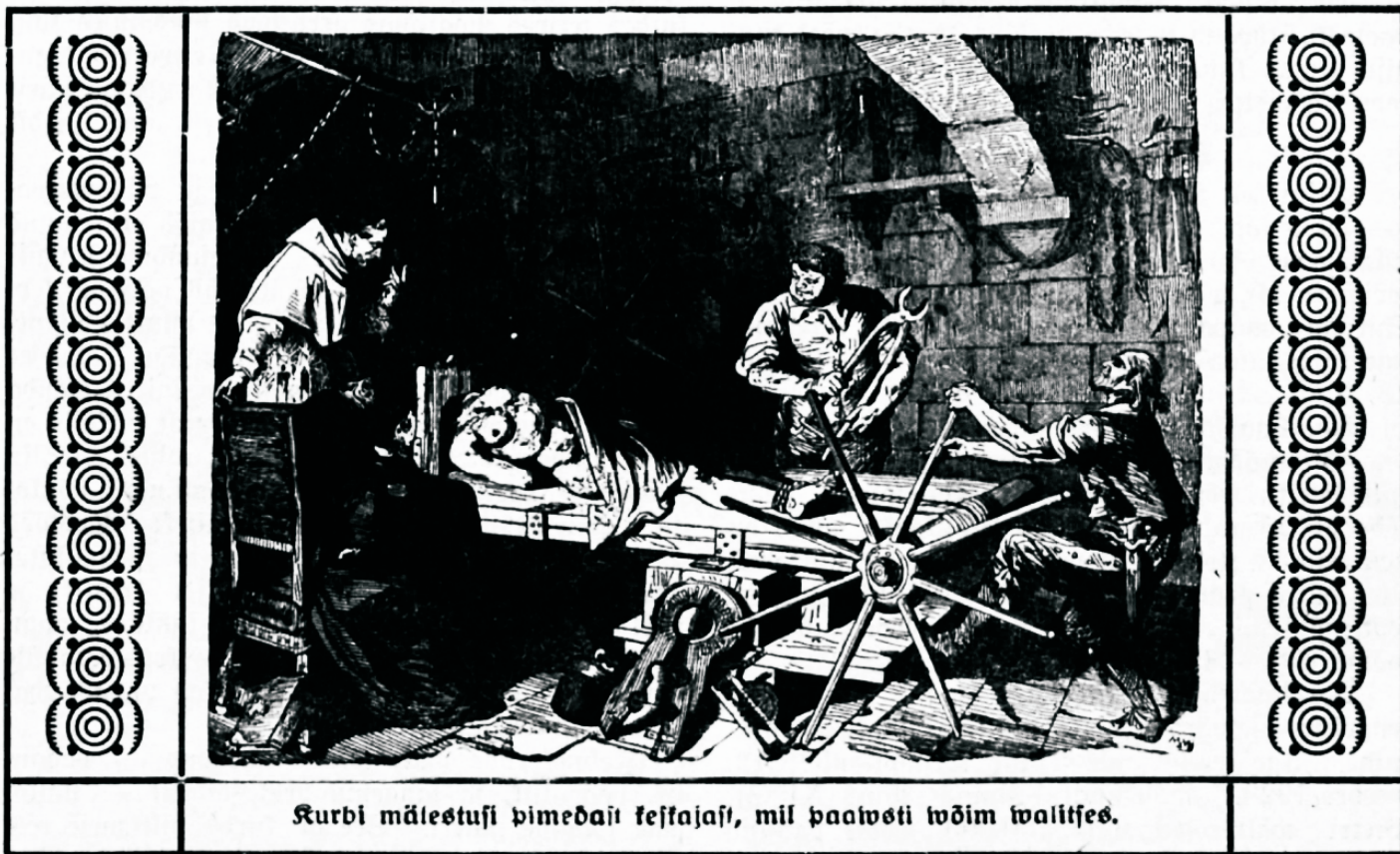
Kurbi mälestusi pimedast tekkajast, mil paavsti võim valitses.

asemel, et pidada Kristust ristijambal lepitusohvriks, seadis paavstivõim sisse igapäevase messe lepitusohvrina. Meie Issanda ja Sünistegija asemel, kes on koguduse pea ja kelle läbi saame pattude andeksandmist, on paavst esile tunginud „Kristuse asetäitjana maa pääl“ ja firiku pea-