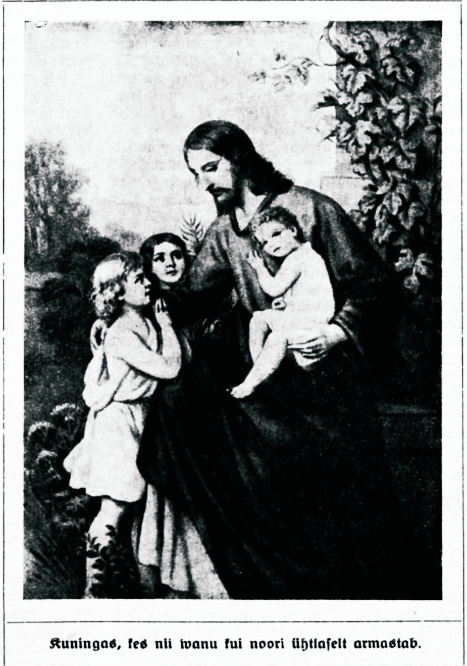
Kuningas, kes nii wanu kui noori ühtlaselt armastab.

litsejana, siis ei ole ja veel tunnud tema kuningas auseisust. Kuningas ei ole mitte ainult valitseja oma riigis, vaid ka oma alamate kaitseja. Kui ühte kuningriigi osa ähwardab waenlane, kas kuningas võib siis rahus edasi valitseda ja asja oma alluva kätte jätta, kes ennast pakub, et waenlasele vastu minna ja temast võitu saada? Ei! Nii punitub kõigepäält kuningasse endaste. Tema on