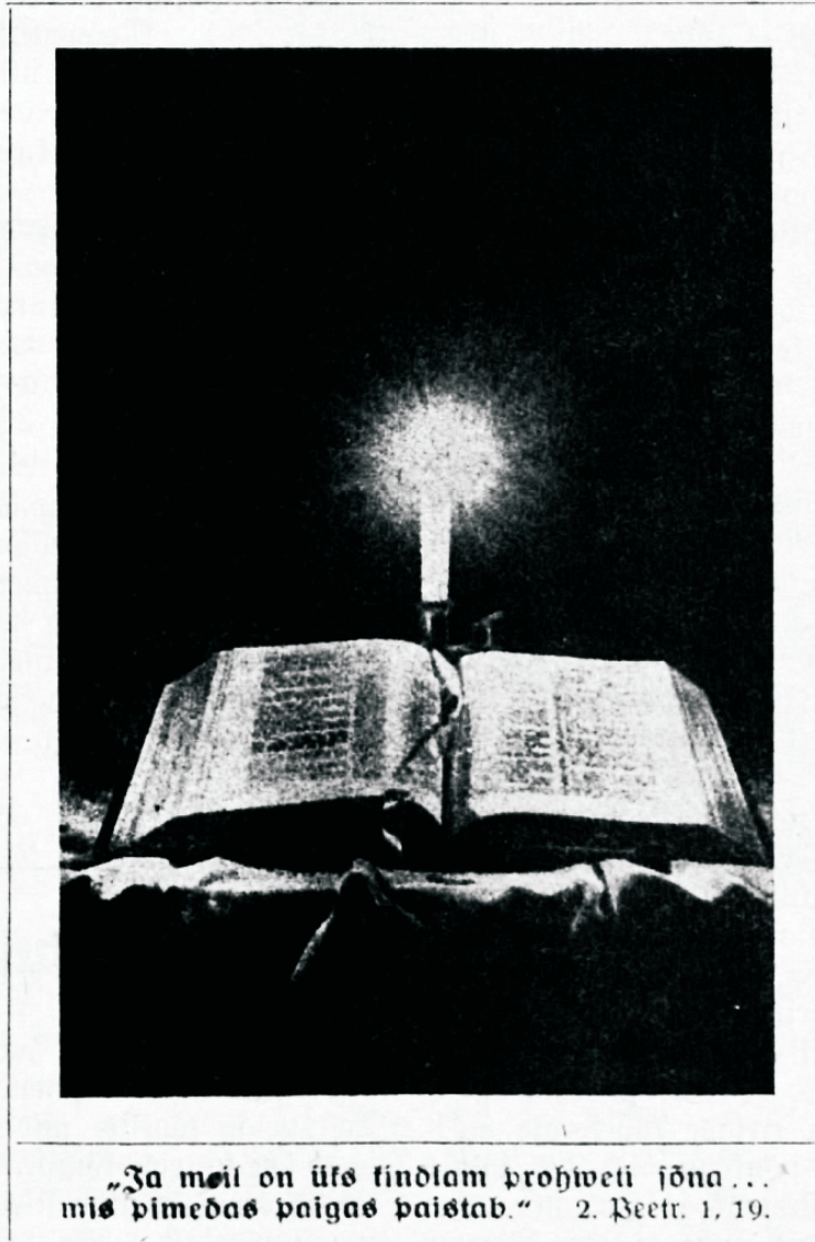
„Ja meil on üks findlam prohveti sõna... mis pimedas paigas paistab.“ 2. Peetr. 1, 19.

Täpelt on firjeldatud tema juuremise wiis. Ta wäifis kui tall ja laskis end tappa. Seda oli ju ka ristija Johannes rääkinud: „Waata, see on Jumala Tall, kes maailma patu ära kannab!“ (Joh. 1, 29.) Wida nad fuulfid naistelt hana juures, oli ju ka