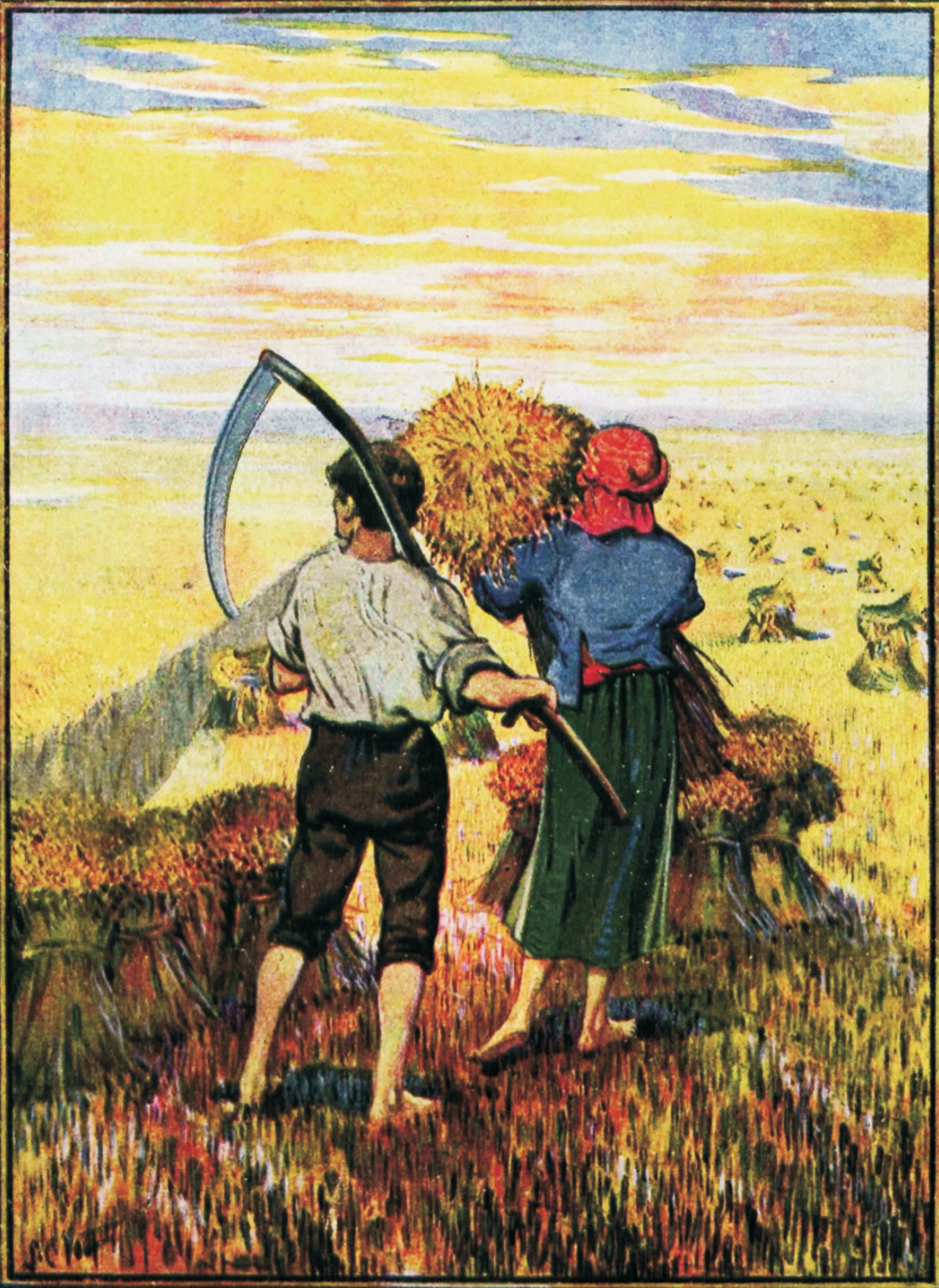
„Teikust on palju, aga pisut tööstegijaid.“