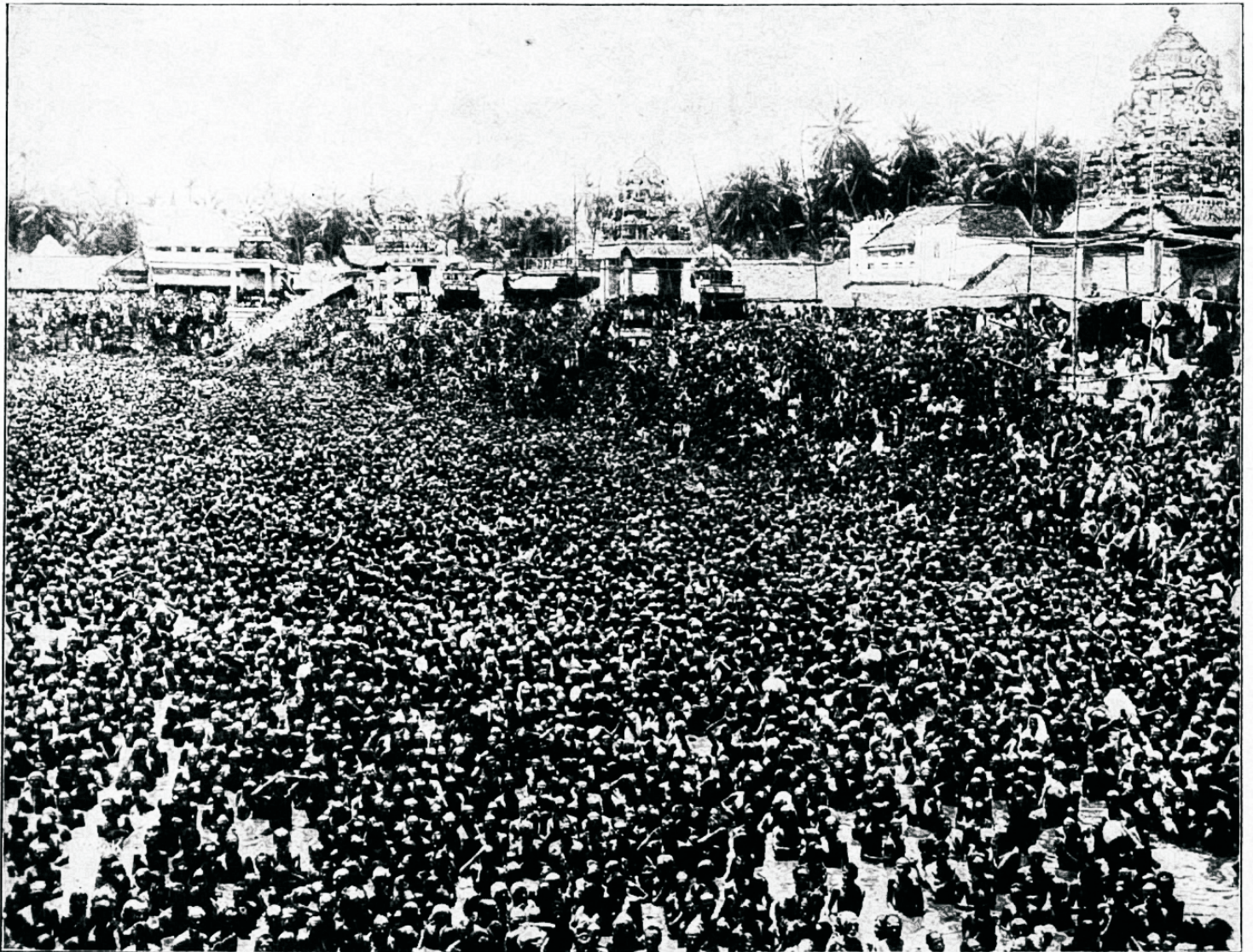
Indulased püüawad ärapeista eneste pattusid Gangesse jões.