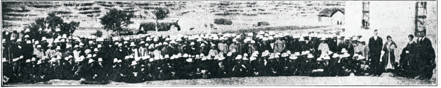
246 Indiaandijaanlaste ristimine.

Üks meie missioonäärudest, indiaanlaste seas, kirjutab: „Kas teil on kaastunnet välismissionitöö kohta? Kas teie tahaksite, et Ewangeliumikuulutus maailmas saaks lõpule viidud? Teie imestate kuuldes et ühe aasta jooksul ainult Titikala järve äärsel missioonipõllul ligi 1000 indiaanlast said ristitud. Jumal on siin uksed avanud kui ei iialgi enam. Meie südamed on liigutud neid südamlikke hüüdeid kuuldes ja meie oleme summitud palujuid tagasi saatma, öeldes: „Dodate veel wähe!“ Kui meil vähemalt kuus hästi ettevalmistatud missionäriperekonda oleks ja 15 pärismaalast-õpetajat, siis võiksite neid Jumala abiga nõnda ärajaotada, et meie veel enne selle aasta lõppu võiks 2000 inimest põhjalikult õpetada ja ristimisele valmistada. Kes tahaks selleks kaajaadata, et see võiks sündida? Meie loodame teie abi pääle kodumaal ja oleme kindlad et teie selleks oma osa teete. Võikust on palju, aga piisut töötajaid!“