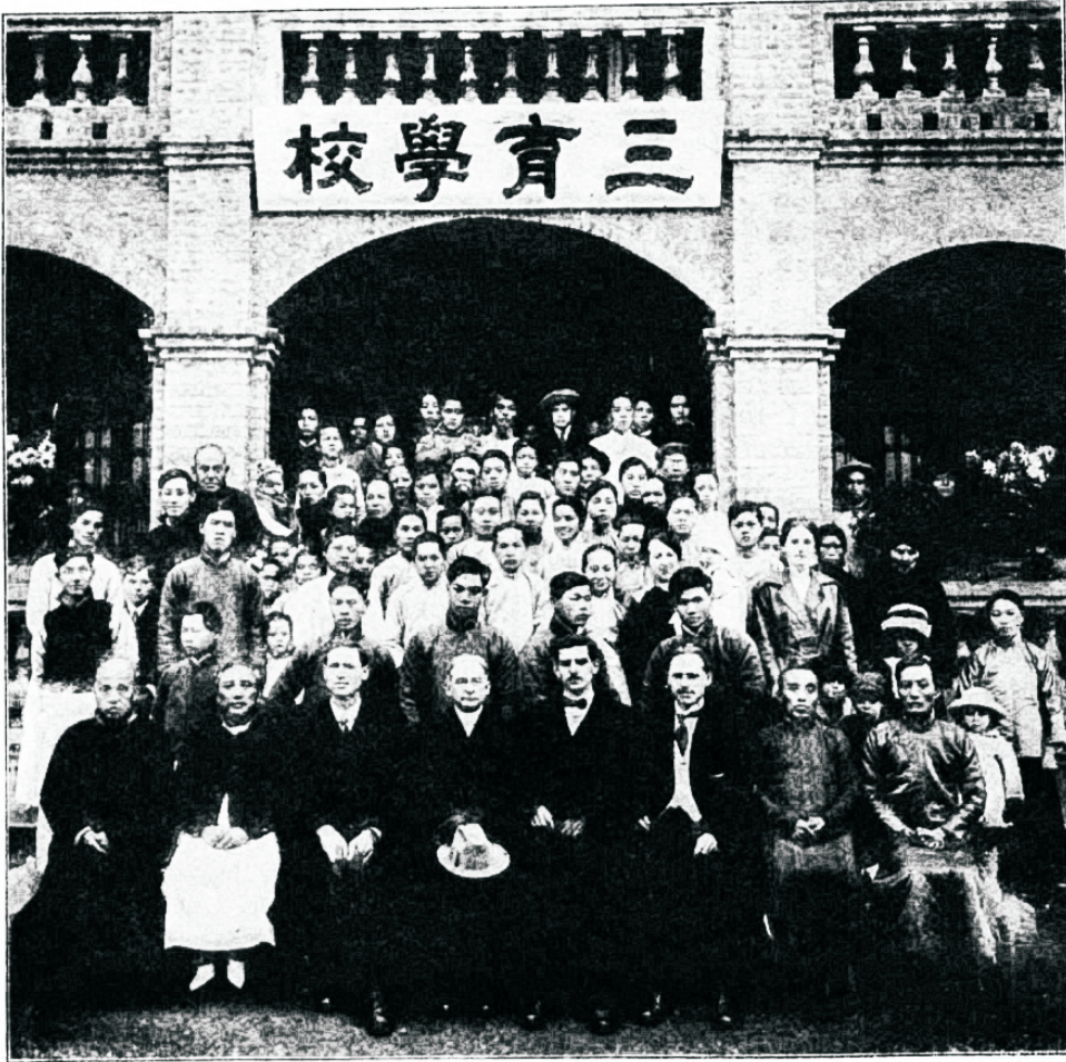
Missioonikool Kantonis, Hiinas.

Selle toleda kumbe arvele peame ka jeda pahet arvama, et 153 miljoni India naise seas 26 miljoni lesed on, see on iga kuues isik, kes enam ualgi ei wõi mehele minna. Naist peetakse mehe surma põhjusel ja leske ei wõeta enam abielusse. Indias on 111,900 last-leske ja ligi 18,000 leske, kes alla 5 aastat wanad.