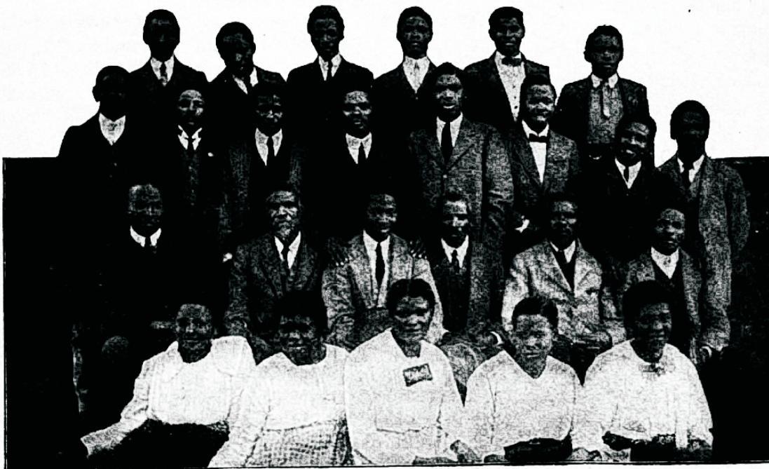
Pärismaalased missioonitöölised Afskaafrikast, keda paganlikust pimeduseft wõidetud.