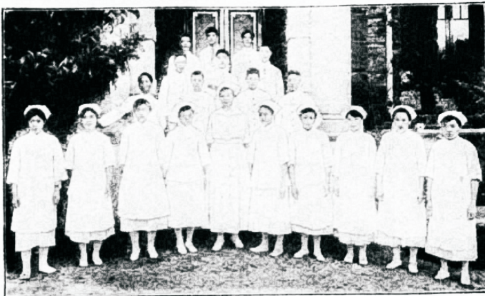
Hiina pärismaalased haigerawitsejad.

Sagedasti on kümneaastased lapsed juba emad, ja teatakse ifegi juhtumistest, kus mõned juba 7. aastajelt emaks saanud. Kristlased kodumaal, kes teie