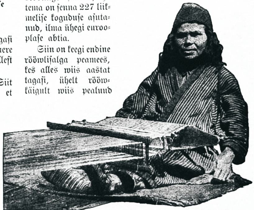
Kuduja Jaapani saarel.

Siin on keegi endine rõõwliisjalga peamees, kes alles wiis aastat tagasi, ühelt rõõwkaigult wiis pealuud