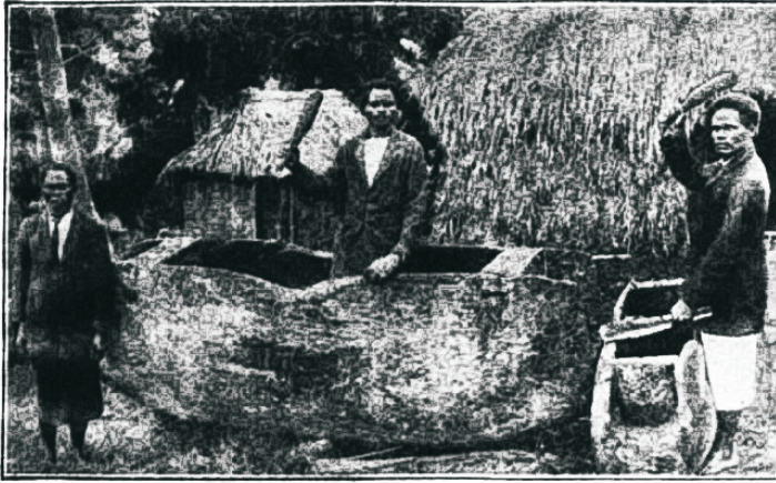
Wanad trummid, millede abil enim „walgetesõmiste pidustustele“ kolkukutsuti; nüüd tarwitatakse neid hingamise päewa kooli kolkukutsumiseks.

See prohwetikuulutus, mis 2500 aastat tagasi awaldatud, läheb täna imelikult täide. Waikse mere saartel on ewangeliumi kuulutusel juur edu, millest järgmised teated jutustawad: