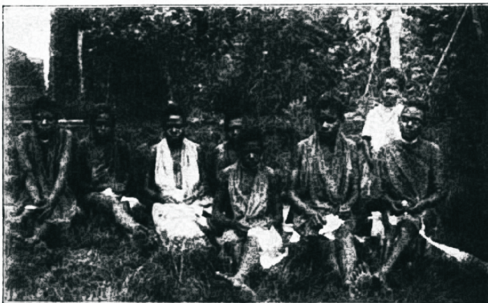
Õmbluskool Uuel, Hebriididel.

Sõpruse saartelt kirjutab üks missioonäär et tema iga päew säält pärismaalastele piibli õpetust jagab, ja neid jutlustajateks, omamaalaste seas, ette walmistab.